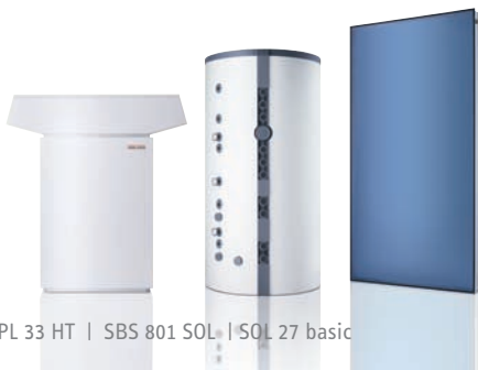
WPL 33 HT | SBS 801 SOL | SOL 27 basic