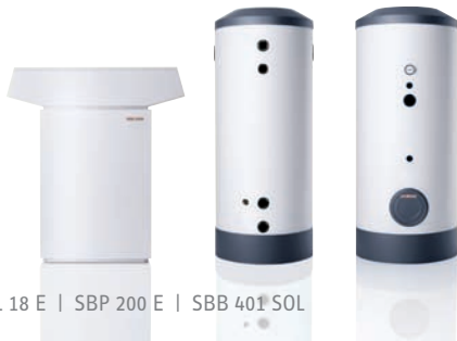
WPL 18 E | SBP 200 E | SBB 401 SOL