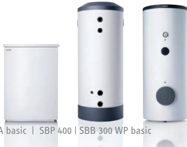
WPL 20 A basic | SBP 400 | SBB 300 WP basic