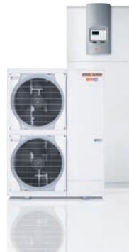
WPL 26 AZ mit Speichermodul