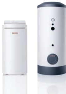
WPF 13 E | SBB 401 WP SOL