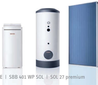
WPF 16 E | SBB 401 WP SOL | SOL 27 premium