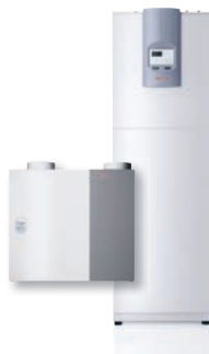
WPC 7 | LWZ 170