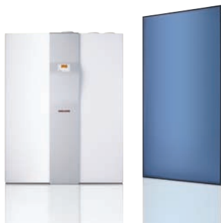
LWZ 304 SOL Set