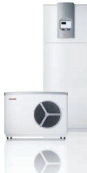
WPL 10 ACS mit HSBB 10 AC